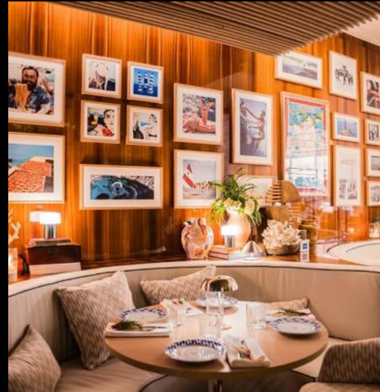
SARDEGNA OSTERIA CAFFÈ