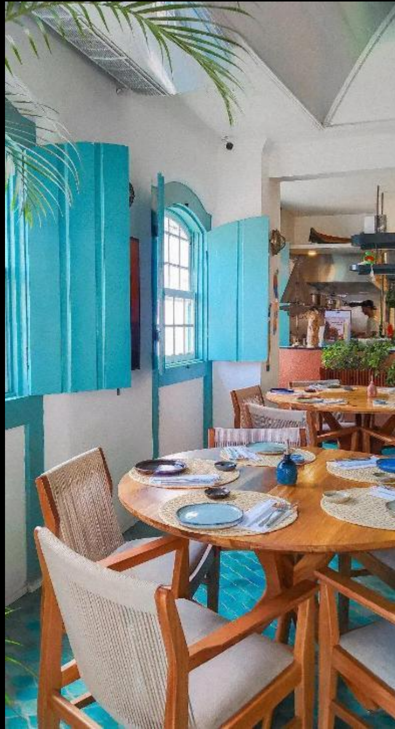
PUPU'S PANC PARTY