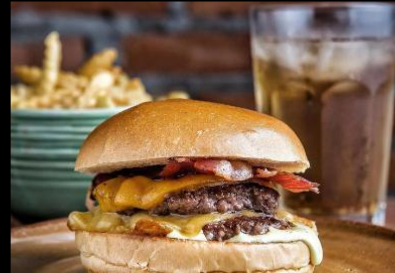
COW ME BURGER