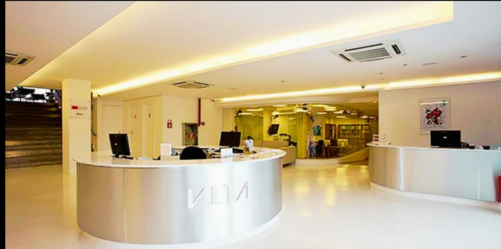
VITA - GRUPO FLEURY