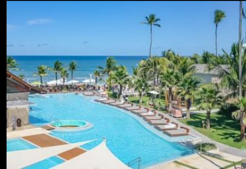
THE WESTIN RESORT