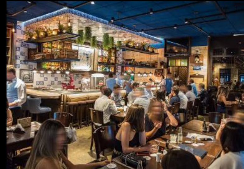
ESPÍRITO SANTO BAR